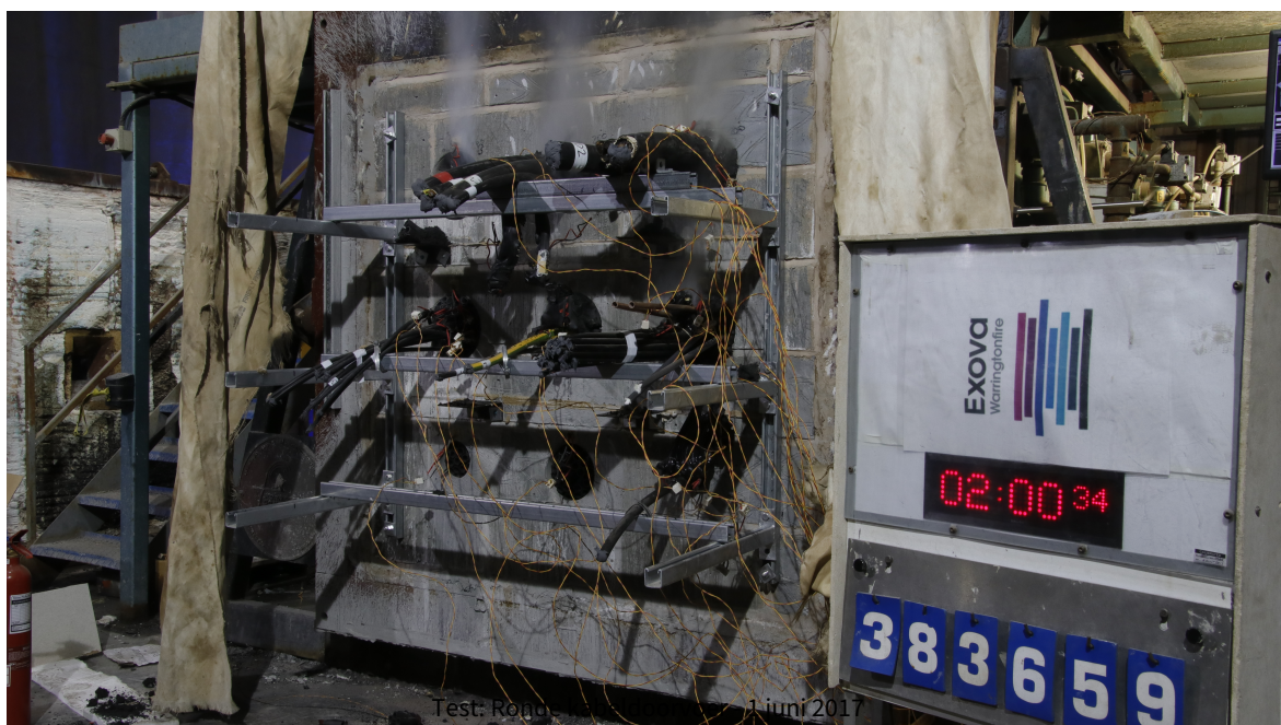
Test: Ronde kabeldoorvoer - 1 juni 2017